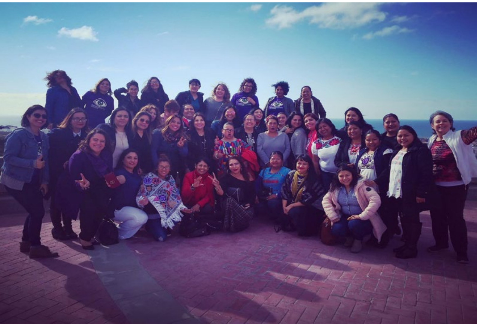
Mujeres Bajacalifornianas de diferentes partidos políticos, funcionarias públicas, mujeres indígenas organizadas, e integrantes de organizaciones civiles en el Seminario de formación: Violencia política por razón de género, llevado a cabo el 9 de marzo de 2019 en Tijuana, Baja California

Facebook: Observatorio Electoral Baja California