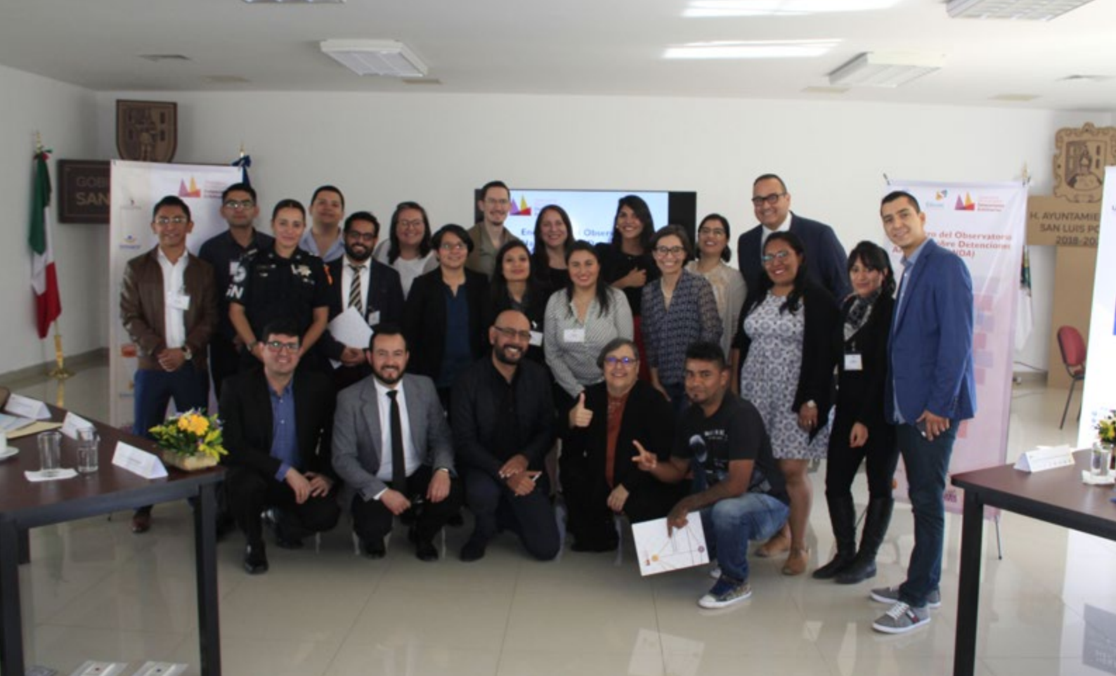
Fuente: Educación y Ciudadanía A.C. (2019), Encuentro del Observatorio Nacional sobre Detenciones Arbitrarias., Centro Unión, Centro, San Luis Potosí, S.L.P.

a las Detenciones Arbitrarias a personas jóvenes como una problemática que viola sistemáticamente sus derechos humanos en el espacio público.